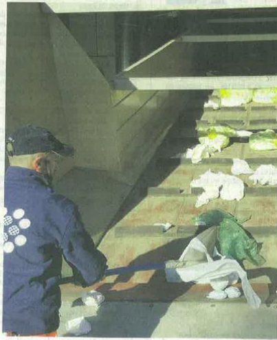
L'usine Fater est dimensionnée pour recycler 10.000 tonnes de couches par an.

Le montant de l'investissement n'est pas révélé, mais « le retour sur investissement est de trois à quatre ans, sans subvention », assure Marcello Somma. La revente de la cellulose, du plastique et des polymères superabsorbants récupérés des couches assure l'équilibre financier, car « les couches utilisent des matières de grande qualité