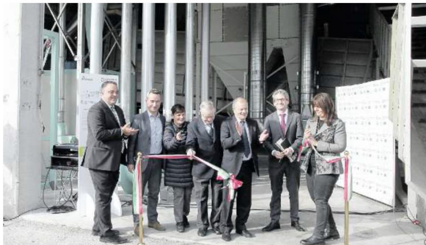
IL TAGLIO DEL NASTRO L'inaugurazione del nuovo impianto di riciclo di prodotti assorbenti usati, al centro Contarina, a Lovadina

SE FOSSE DIFFUSO A LIVELLO NAZIONALE IL SISTEMA EVITEREBBE EMISSIONI IN ATMOSFERA EQUIVALENTI A QUELLE DI CENTOMILA AUTO