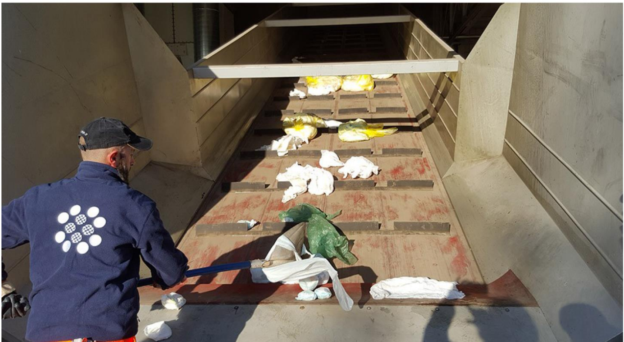
Le camion benne déverse son chargement de couches-culottes directement sur le tapis roulant à l'entrée de la ligne de recyclage.

MYRIAM CHAUVOT ( HTTPS://WWW.LESECHOS.FR/JOURNALISTES/INDEX.PHP?ID=324 ) | Le 25/10 à 16:50