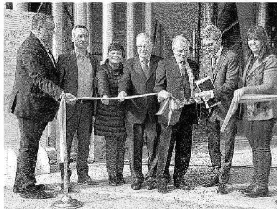
L'inaugurazione dell'impianto di Contarina per riciclare i pannolini